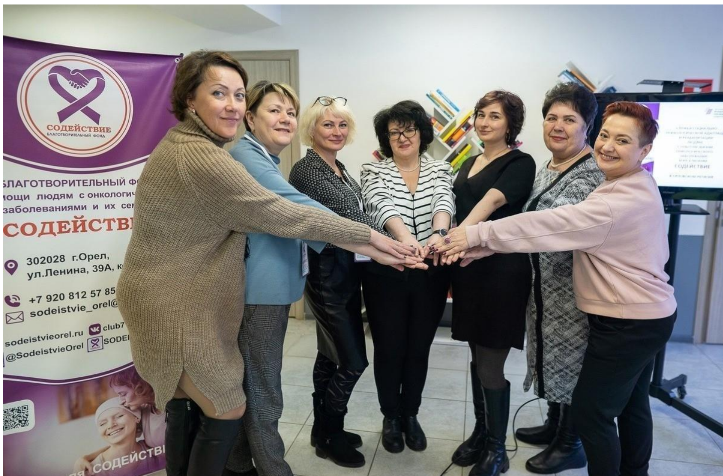
Волонтеры равный-равному Б Ф Содействие