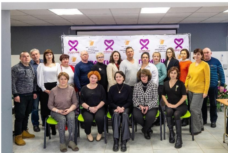
Команда «Службы Содействие»