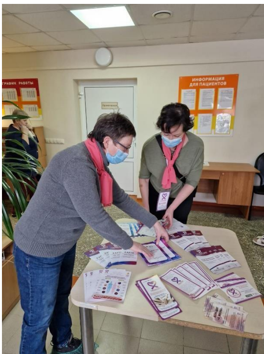
Равный-равному Службы Содействие