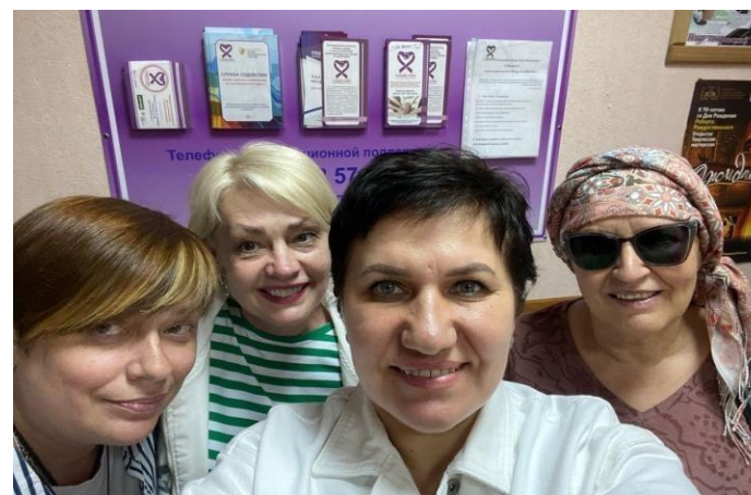
Телесно-ориентированная терапия для онкопациентов